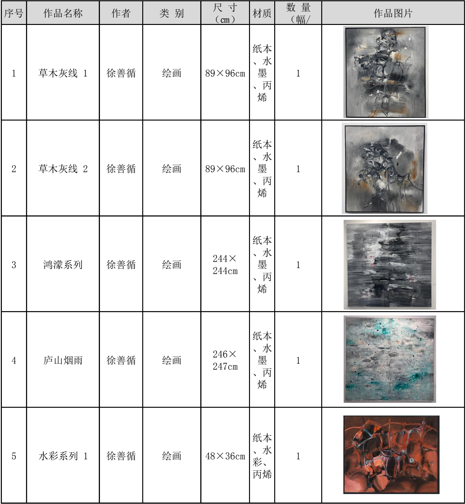
艺术品进出口名录 (V20230912)