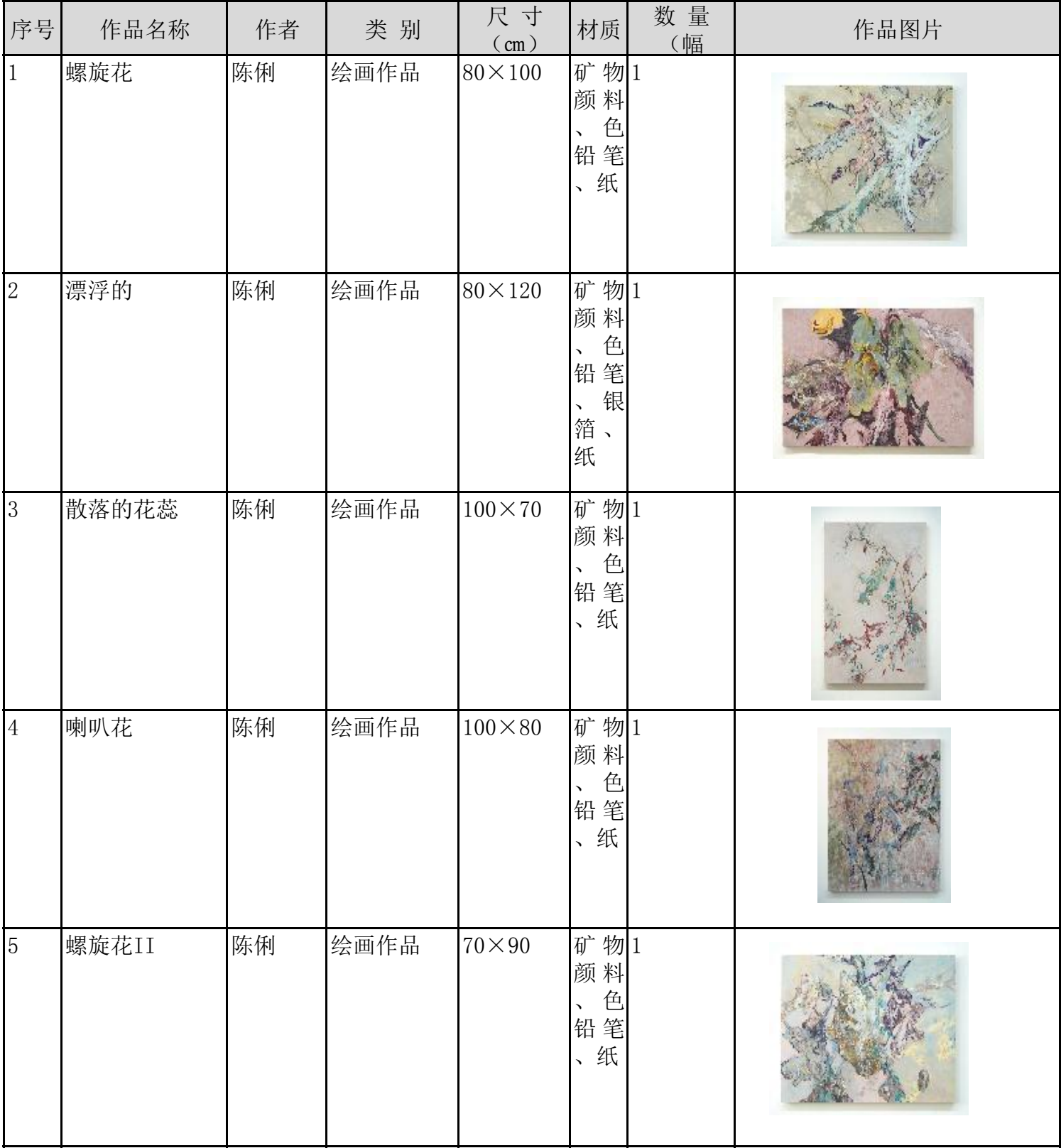
艺术品进出口名录 (V20230912)